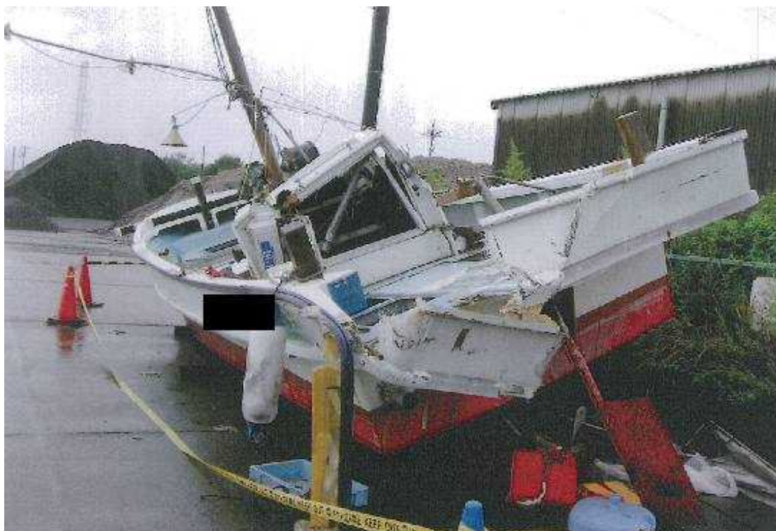
写真2 B船の損傷状況