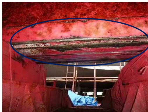
写真2 船底キールに擦過傷