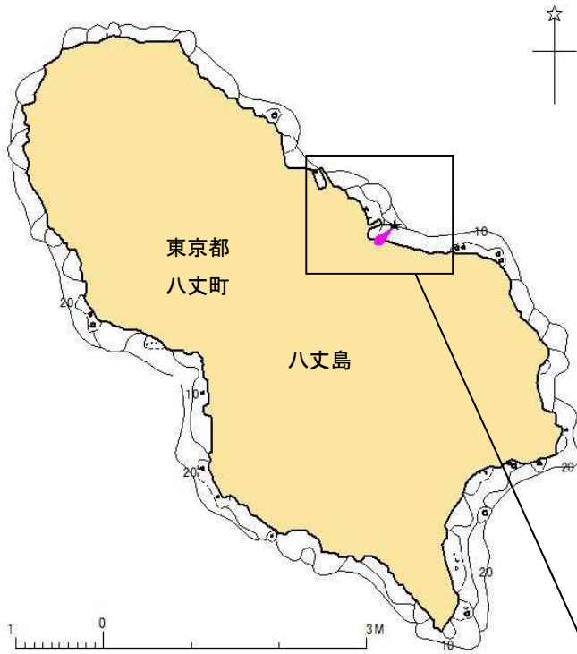
付図1 事故発生経過概略図