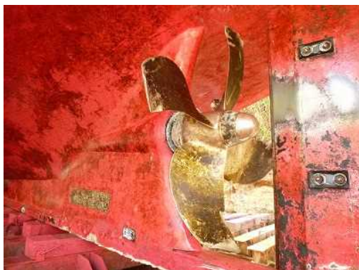
写真1 プロペラ翼の損傷状況