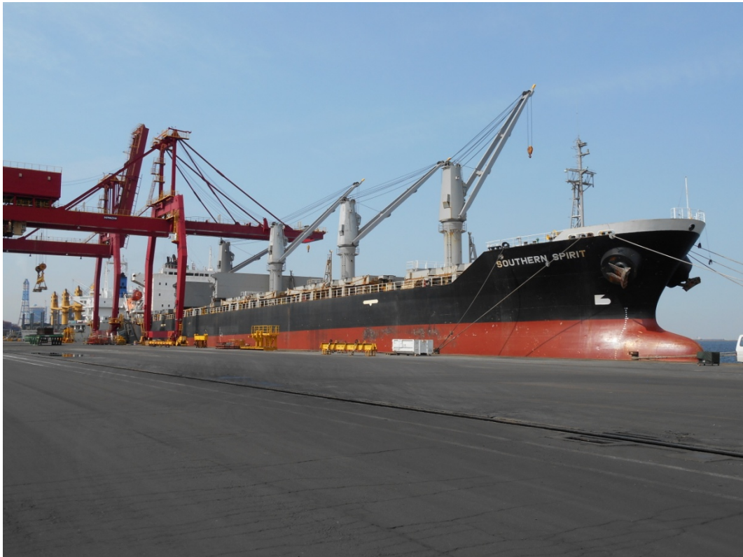
写真2 A船の船橋からの視界の状況