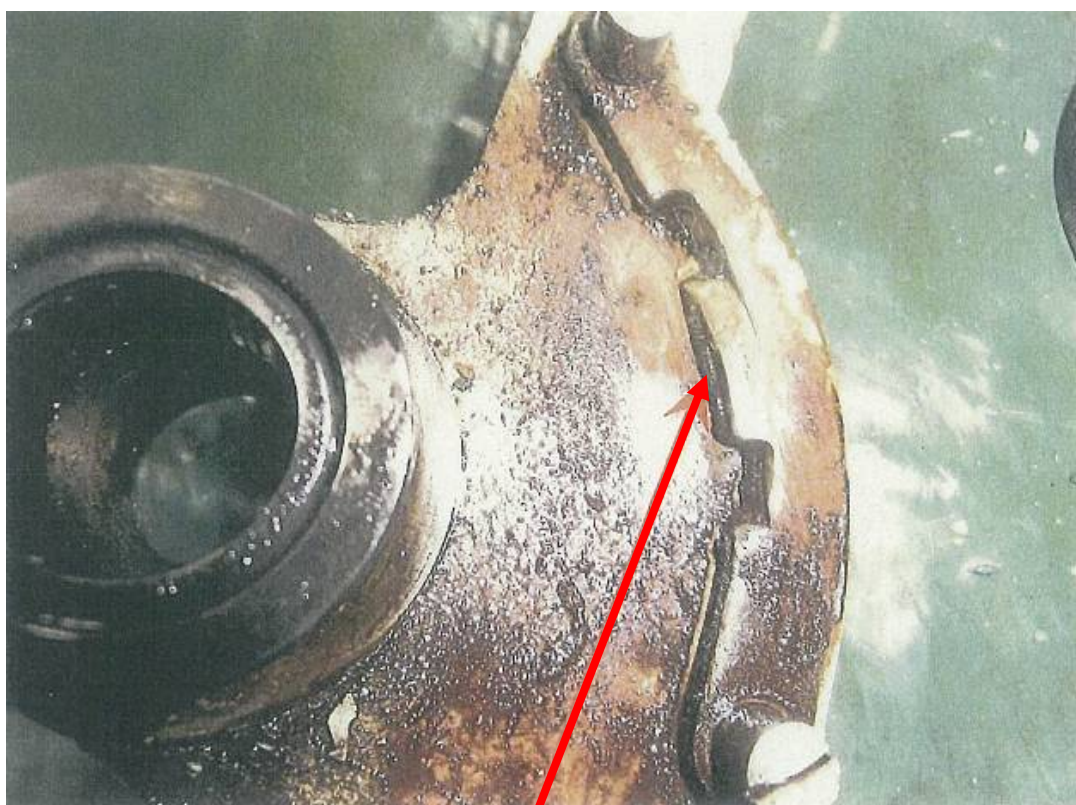
損耗したラッチの駒