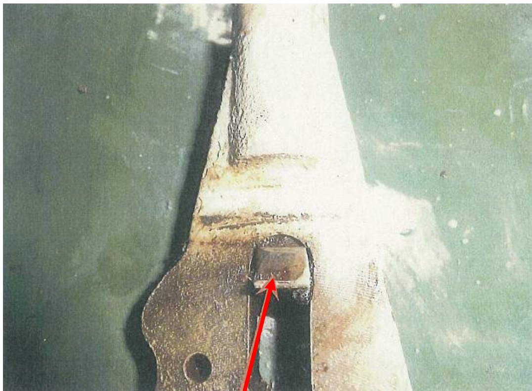
損耗したラッチの駒