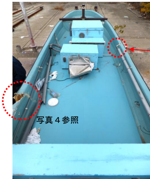
写真2 B船（前部の状況）