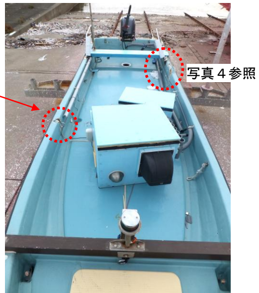
写真3 B船（後部の状況）