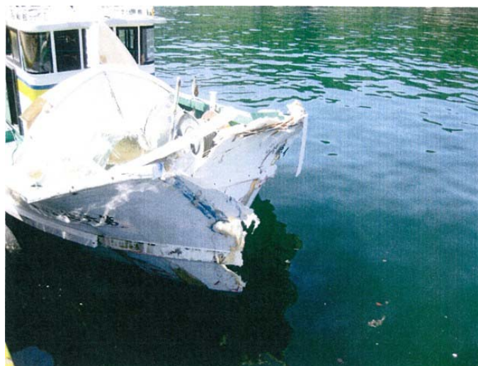
写真3 B船の損傷状況（船首部水線下）