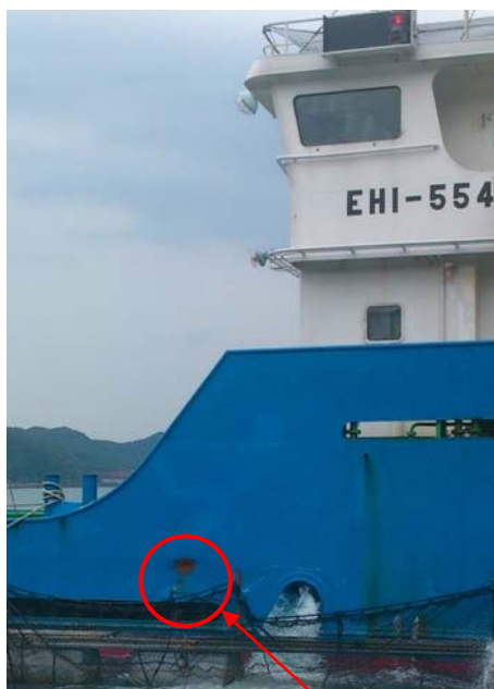
損傷場所（上甲板と船尾楼甲板の境界付近）