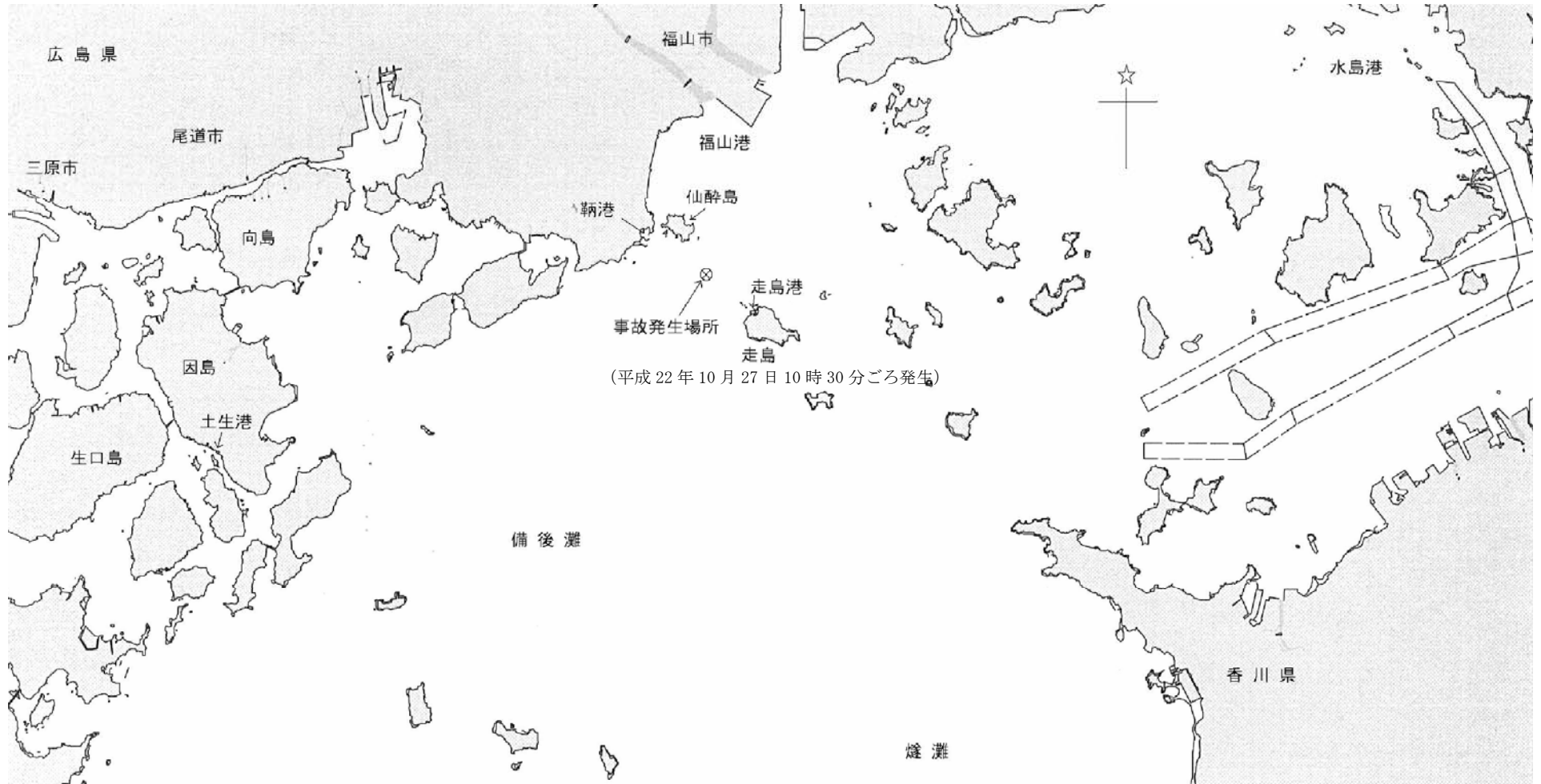
付図1 事故発生場所及び周辺