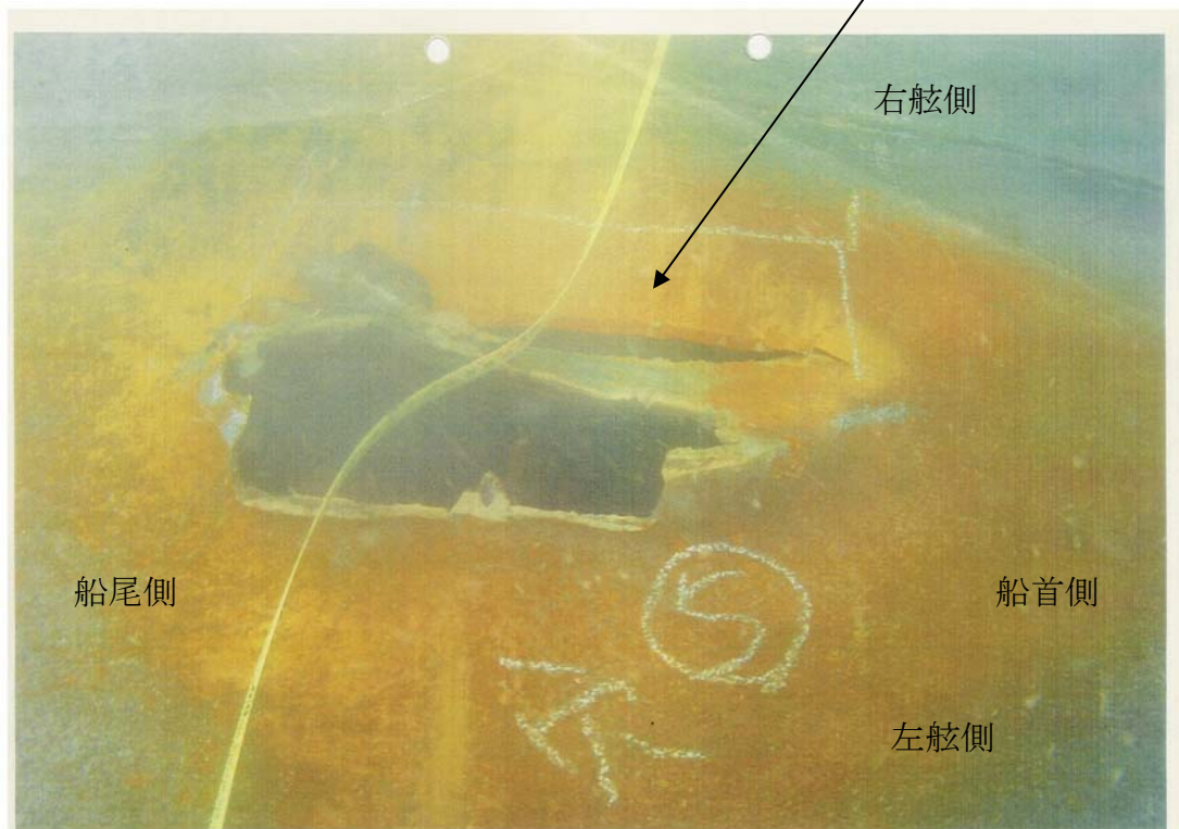
写真1 船底の損傷状況

破口：船尾端から約14m付近の左舷側 破口の大きさ：長さ約28cm、幅約10cm