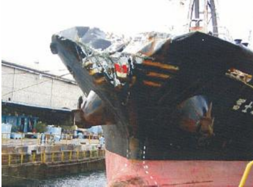
写真2 B船の損傷状況