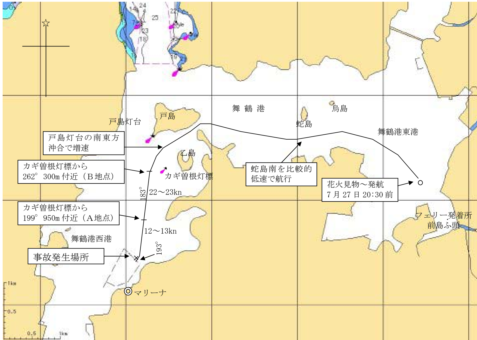
付図1 推定航行経路図