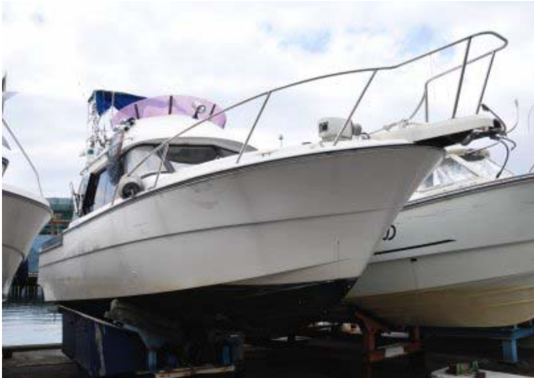
写真2 同型船の船体写真（後方より）