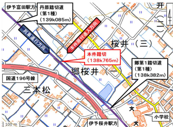
<事故現場付近略図>