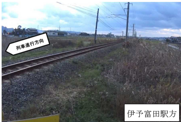
<上り列車から見た中土踏切道見通し状況>