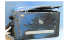
出火時の状況及びバッテリー破損状況