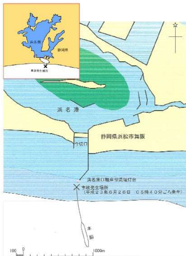
図 21 - 推定航行経路図

また、ボックスの横に付いた「 ○ (赤丸) 」は、このような要因がなければ、事故は発生しなかったであろうことを強調する「 排除ノード 」と称されるものです。排除ノードは、直接原因や背景要因などに等しいものであるため、一般に変動要因のボックスと重なります。