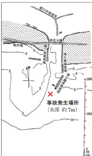
図 20 - 今切口概略

なお、本件は小型旅客船の事故ではありませんが、同じく小型船舶を用いて乗客を輸送していた事実及び事故の特性等から参考になると思われるため、その事例紹介を行うものです。