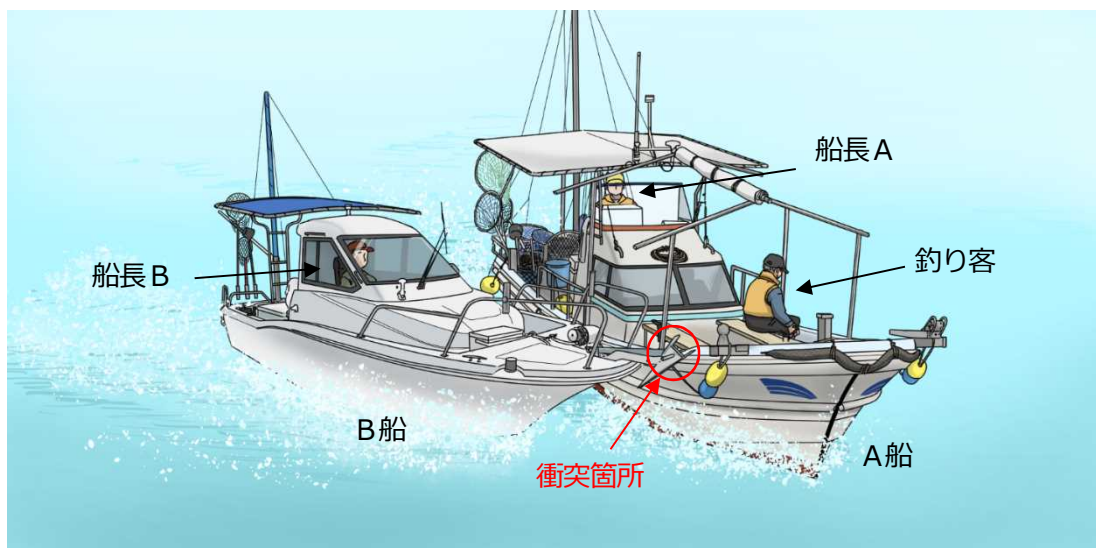
衝突時の状況（イメージ）

A船の前部甲板に設置されたオーニングの支柱とB船の船首部に設置されたアンカーとが衝突