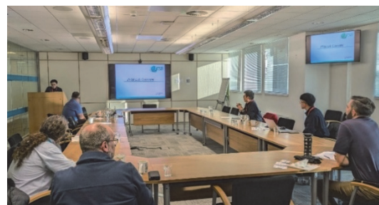
令和6年のAIB-TGでの 当委員会船舶事故調査官の発表の様子

前回に引き続き、令和6年も英国サウサンプトンで開催され、当委員会から船舶事故調査官が参加しました。