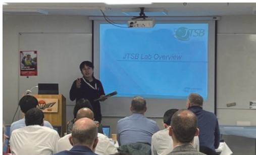
令和6年のAIRでの 当委員会航空事故調査官 の発表の様子

記録装置事故調査官会議（Accident Investigation Body - Technical Group (AIB-TG) Meeting）は各国の事故調査機関において船舶の電子記録（VDR、AIS、GPS、ECDIS、CCTV 等）を扱っている解析担当者が出席し、船舶事故に特化した解析業務に関する研究事例の共有や各国における課題解決策の検討等を目的として令和5年から開催されています。