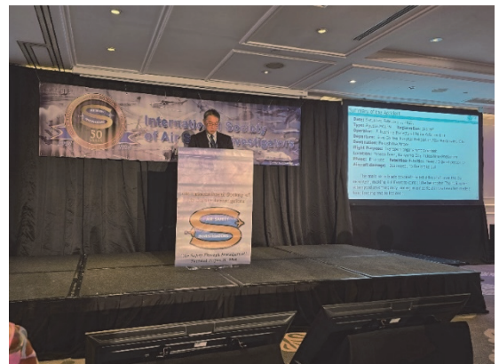
令和6年のISASIでの 当委員会航空事故調査官の発表の様子

ISASIの地域協会は、豪州（ASASI）、カナダ（CSASI）、欧州（ESASI）、フランス（ESASI French）、韓国（KSARAI）、中東・北アフリカ（MENASASI）、中南米（LARSASI）、ニュージーランド（NZSASI）、パキスタン（PakistanSASI）、ロシア（RSASI）、米国（USSASI）にもそれぞれ設立されており、各地域協会でもセミナーが開催されています。