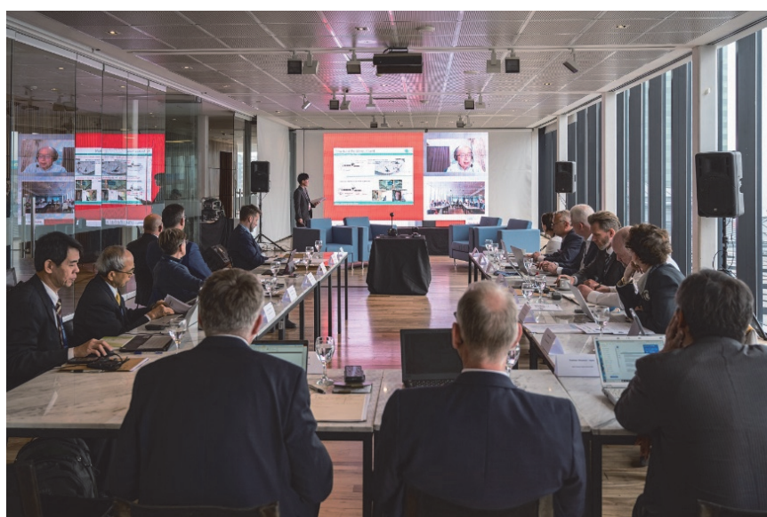
令和6年のITSA委員長会議の様子

今回の会議では、各国がテーマ毎に調査事例や取組みを紹介するパネルディスカッションを行いました。当委員会委員長からは滑走路における安全確保をテーマとして近年の事故事例について発表を行いました。また、当委員会委員からは事故等被害者への対応及び事故等被害者と連絡を取り合うことにより事故調査が進捗した事例などに関するプレゼンテーションを行いました。