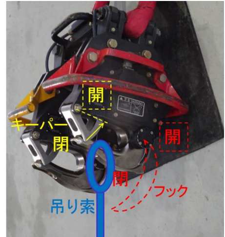
(図1 カーゴフックのつり下げ及び開閉（イメージ）)

同機は、生コン下ろし場に到着後、機上作業員の遠隔操作によりバケットから生コンクリートを下ろした後、空になったバケットをつり下げたまま、次の物資輸送のため、荷つり場に向かって飛行した。機上作業員は、飛行中、スイッチ・ボックスの注意灯を見て、バケットをつり下げている黄フックもロックされていることに気付いた。次の物資輸送では、フックの劣化を防ぐために今回とは異なる黄フックにバケットをつり下げることとしていた。経路上ではあるが、地上作業員のロック解除の手間を省くことを意図して、スイッチ・ボックスを操作し、黄フックのロックを解除することとした。機長に対してどちらのフックとは言わずにロックを解除することのみを通知し、操作をしたところ、バケットをつり下げている赤フックのロックを解除してしまい、バケットが落下した。