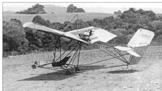
図1 同型式機(型式仕様書から引用)