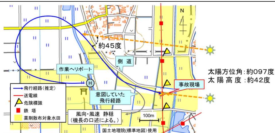
図5 飛行経路 (推定)