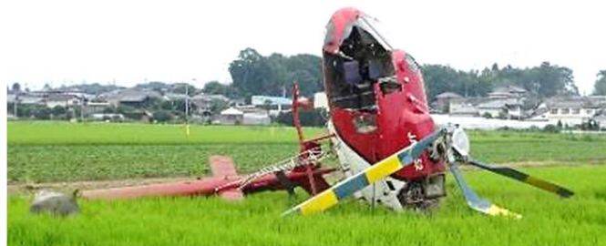
図2 同機の墜落状況