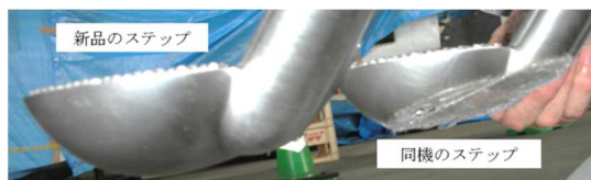
写真1 ステップの損傷状況