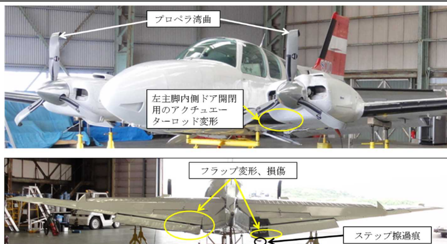
写真2 機体前方及び後方の損傷状況