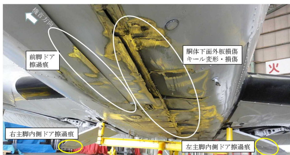
写真3 機体下面の損傷状況