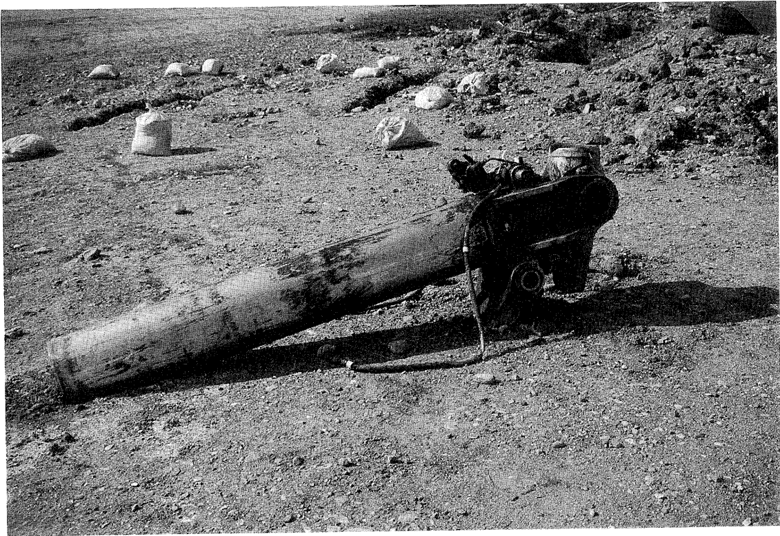
写真22 左主脚タイヤ及びブレーキ・アセンブリ