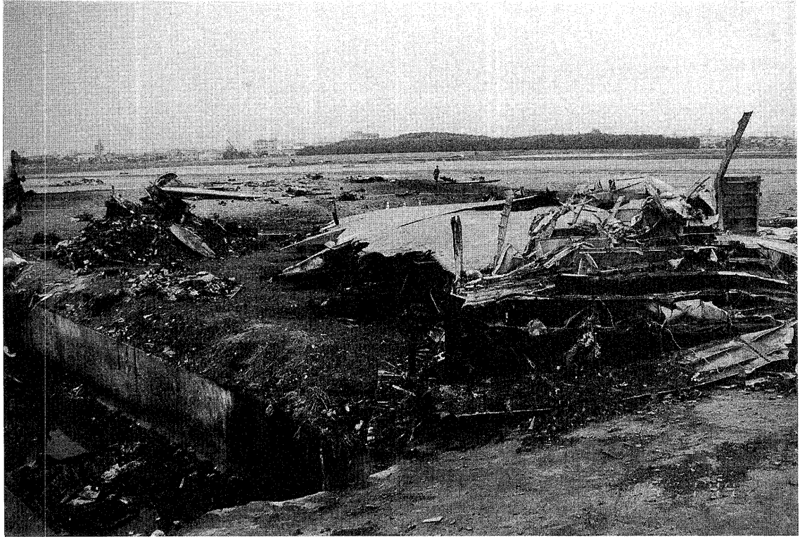
写真20 右主翼の破断箇所