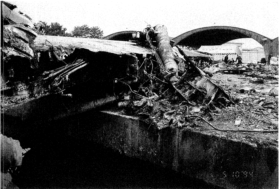
写真24 右主脚タイヤ