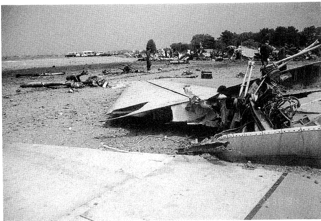
写真10 右エレベータ