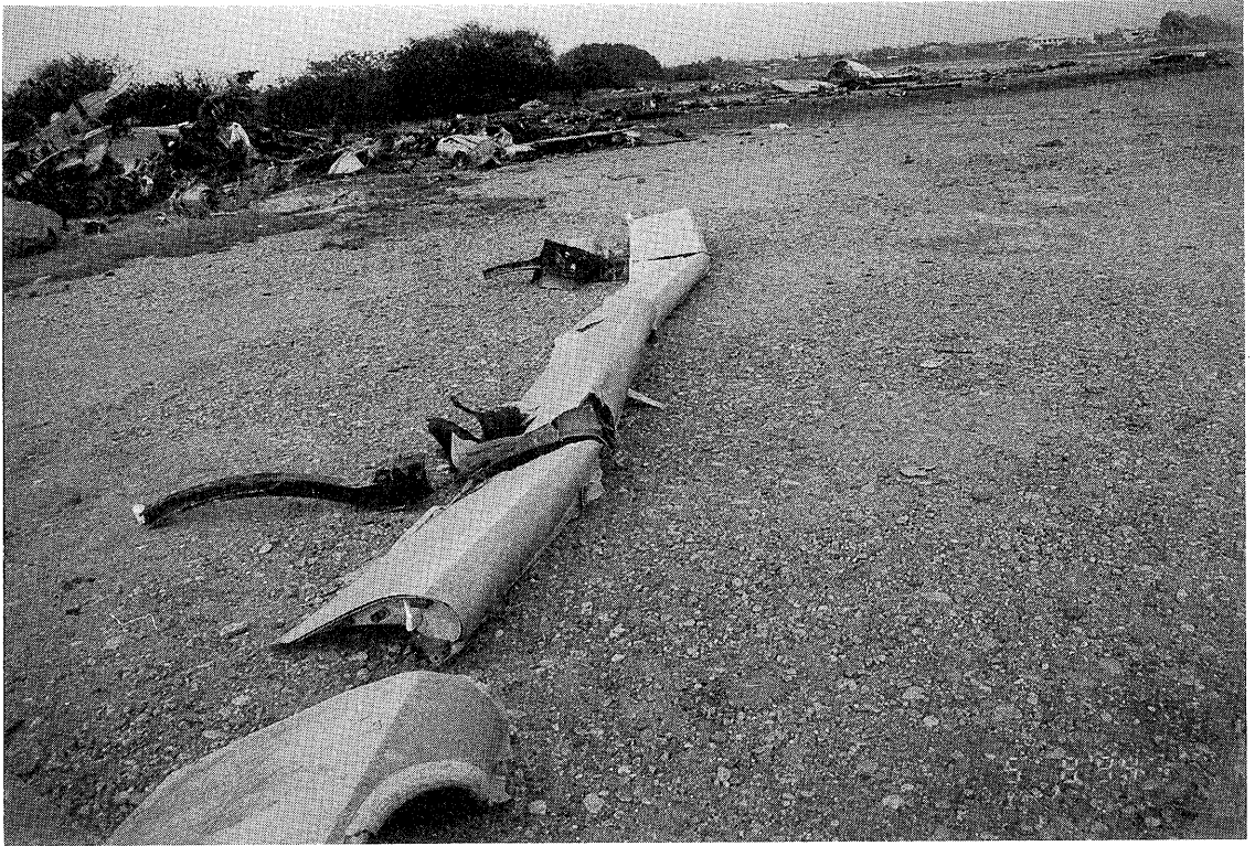
写真18 右アウタ・スラット